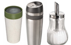
Herbruikbare bekers en dispensers (i.p.v. portieverpakkingen)