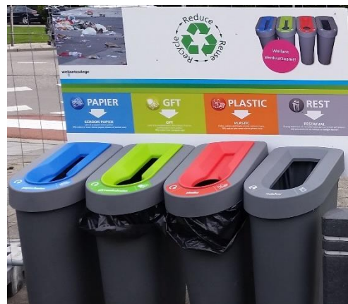
Bij deze prullenbakken is goed nagedacht over de kleuren van de bakken en de verschillende inwerpopeningen (Wellantcollege Aalsmeer)

Het is belangrijk dat er in het gehele pand eenzelfde soort bak staat met daarbij verschillen in kleur voor de verschillende afvalstromen. Het moet altijd direct duidelijk zijn welk afval er in de bak hoort. Daarom is het belangrijk dat de juiste kleuren en pictogrammen op de bakken staan. Daarnaast kan de vorm van de afvalbak ook een belangrijke bijdrage leveren, zoals een passende inwerp-opening voor de betreffende afvalstroom. Een opening voor papier is vaak smal en een opening voor glas rond.