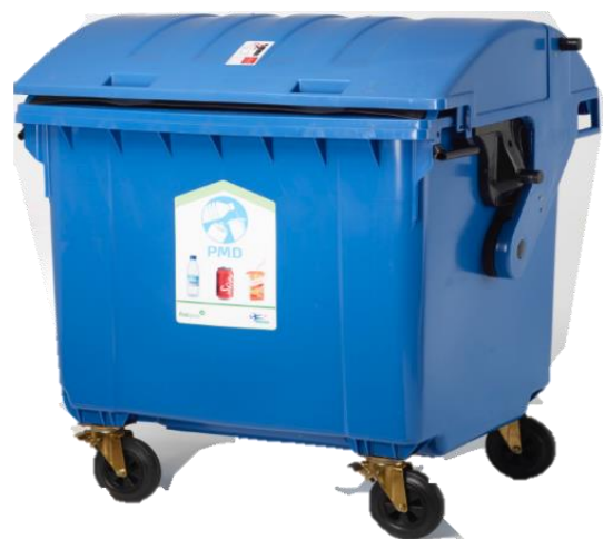
Voorbeeld van een PMD rolcontainer

Deze twee afvalstromen kunnen op dezelfde manier verwerkt worden. Veel scholen werken nu nog met grote zakken voor PMD en restafval die bewaard worden in opbergruimtes (vooral PMD) of buiten. Een rolcontainer zou een oplossing kunnen bieden voor het beter bewaren van het afval, voordat de zakken door de afvalinzamelaar opgehaald worden. Mocht je hier als school geen ruimte voor hebben, dan kan een ondergrondse container (van de gemeente) in de wijk een oplossing bieden. Hierover kunnen afspraken gemaakt worden met de gecontracteerde afvalinzamelaar.